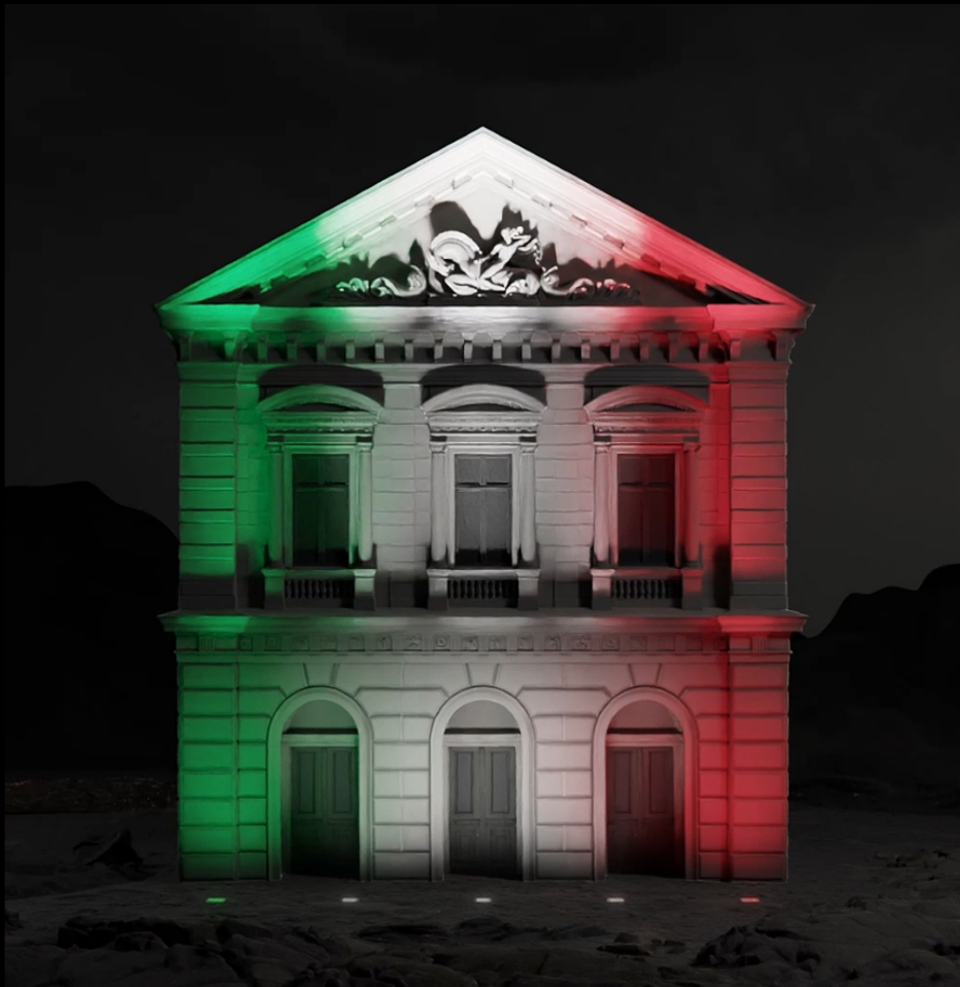
Esempio di installazione prodotto